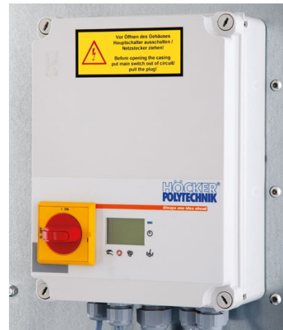
Abb. rechts: SPS-Steuerung mit Textdisplay und robuster Folientastatur

Für die Aufstellung im Arbeitsraum auch bei explosionsfähigen Staub-Luft-Gemischen und bei Prozessabläufen mit Betriebspausen, in denen es die Filtermedien über Vibration schonend reinigt, ohne Druckluft zu benötigen.