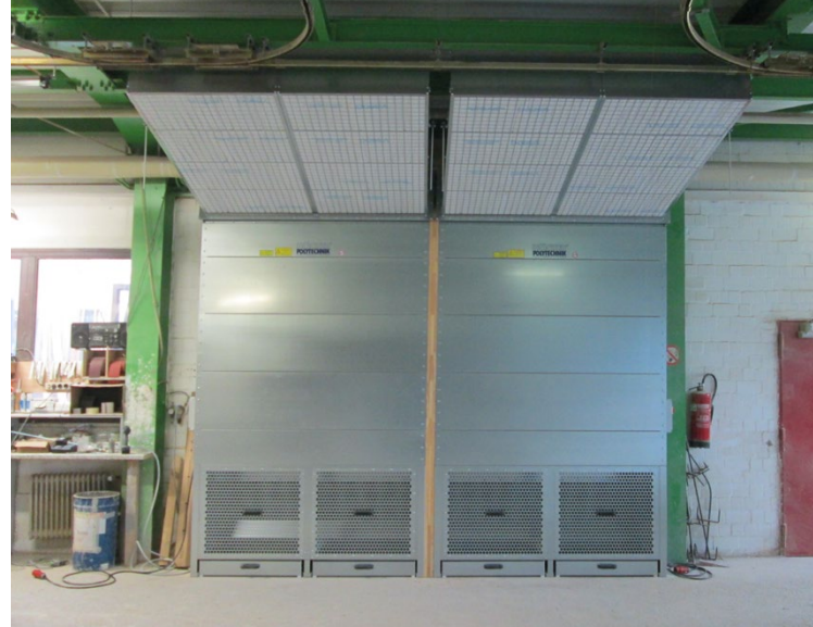
Abb.: Zwei DustStars im praktischen Einsatz (mit Sonderzubehör)

Schleif- und Feinstäube werden über ein 2-stufiges Filtersystem mit 16 m 2 Filterfläche im Innenbereich und ~2 m 2 im Zuluftkanal (M5-Filtermatten) gereinigt und ausgelesen. Die Filterung arbeitet hocheffizient und ermöglicht die unkomplizierte Rückführung* der gefilterten Luft in den Arbeitsraum. Die wertvolle Wärmeenergie bleibt so erhalten und die Installation des DustStars vereinfacht. Einfach aufbauen, anschließen und schleifen.