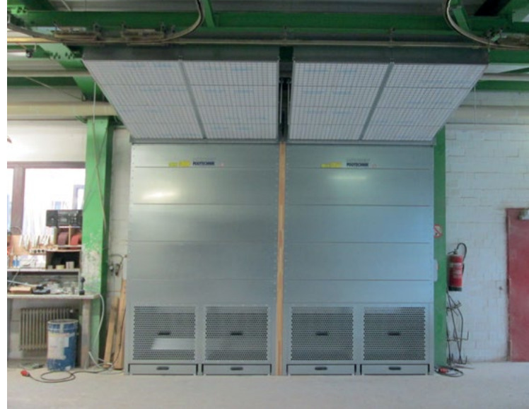
Abb.: Zwei DustStars im praktischen Einsatz (mit Sonderzubehör)

Schleif- und Feinstäube werden über ein 2-stufiges Filtersystem mit 16 m 2 Filterfläche im Innenbereich und ~2 m 2 im Zuluftkanal (M5-Filtermatten) gereinigt und ausgetragen. Die Filterung arbeitet hocheffizient und ermöglicht die unkomplizierte Rückführung* der gefilterten Luft in den Arbeitsraum. Die wertvolle Wärmeenergie bleibt so erhalten und die Installation des DustStars vereinfacht. Einfach aufbauen, anschließen und schleifen.